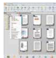
Pantalla principal de PaperPort SE14

- La elección profesional para organizar y compartir sus documentos