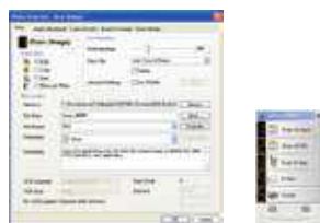
Pantalla principal de Button Manager V2

Completa su escaneo con un paso sencillo