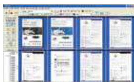
Pantalla principal de AVScan X

Herramienta de gestión inteligente de documentos